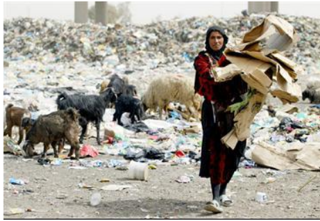
راعية عراقية تجمع علب الكرتون في إحدى ضواحي بغداد (ا ف ب)

المصدر: جريدة الرأي الكويتية الاثنين 09 مارس 2009 العدد 10843 http://www.alraimedia.com/alrai/Article.aspx?id=117102