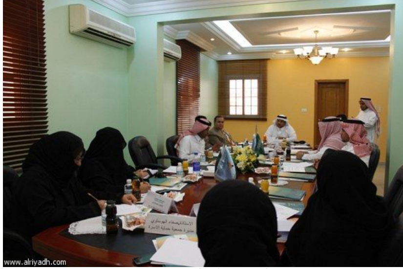
الاجتماع قبل اقتحام الرجل وتهديده بإحراق نفسه