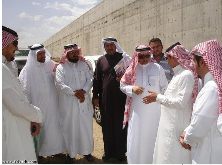
أعضاء حقوق الإنسان خلال زيارتهم للمشروع