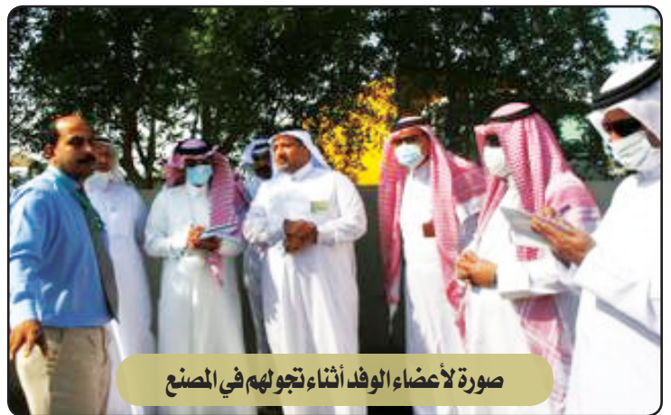
صورة لأعضاء الوفد أثناء تجولهم في المصنع

الشريف: من أهم السبلات التي رصدها الوفد هو عدم وجود فلاتر في محطات الفرز لدى مصنع النفايات الطبية والتي بدورها تمنع انبعاث الغازات الضارة إضافة إلى قرب المسافة بين المصنع والتجمعات السكنية حيث لا يبعد سوى واحد كيلو متر.