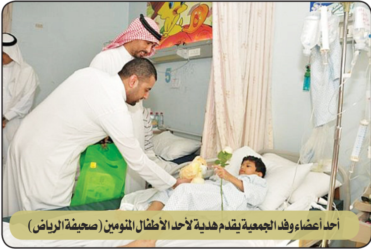
أحد أعضاء وفد الجمعية يقدم هدية لأحد الأطفال المنومين