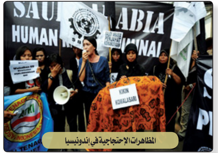
المظاهرات الاحتجاجية في إندونيسيا