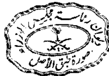
فهد بن عبدالعزيز