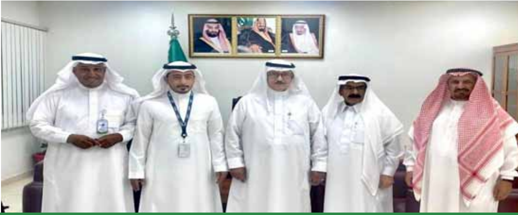
وفد من فرع الجمعية الوطنية لحقوق الإنسان في الجوف يزور مكتب مؤسسة التأمينات الاجتماعية بالمنطقة