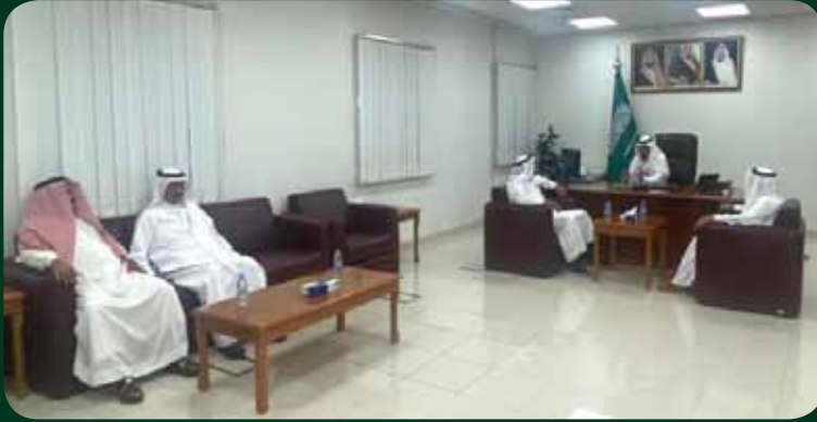
زيارة وفد من فرع الجمعية في الجوف مكتب مؤسسة التأمينات الاجتماعية