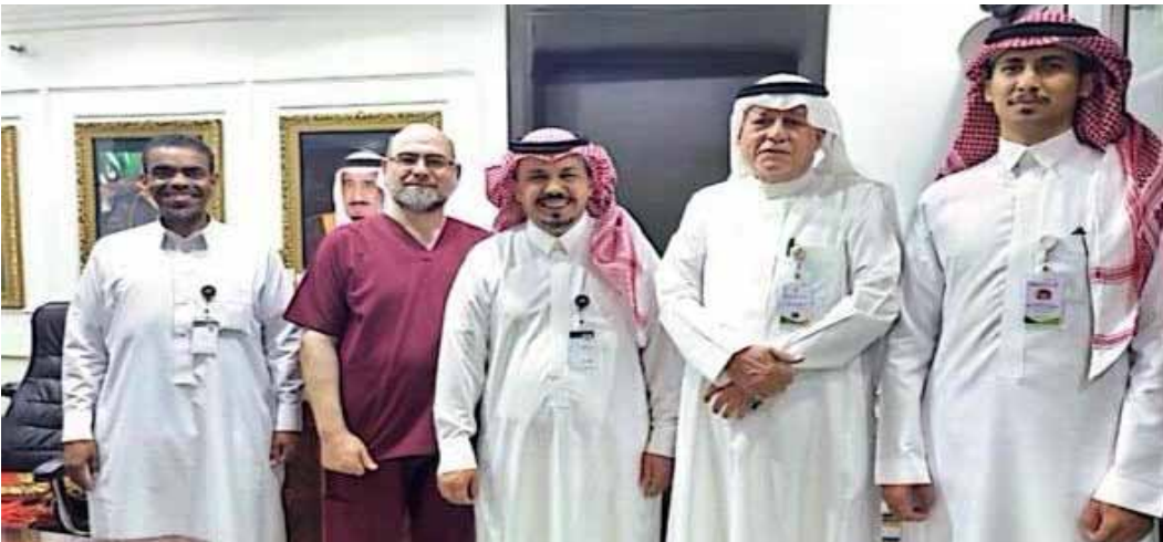
في اليوم العالمي للمسنين وفد من فرع الجمعية في منطقة مكة المكرمة يزور دار الرعاية الاجتماعية (المسنين- المسنات)

فرع الجمعية الوطنية لحقوق الإنسان بمنطقة المدينة المنورة يعقد لقاء توعوي تثقيفي